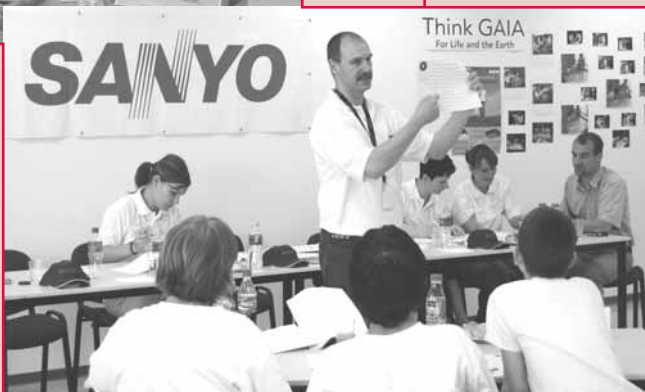
Az utolsó forduló egy pillanata ►